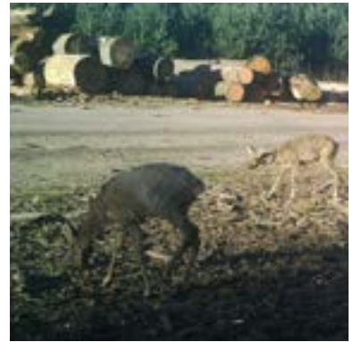
21 maart 2020: bok heeft alleen nog een wat haar op de rug; de geit heeft normale verharing.