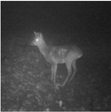
21 januari 2020: eerste plek zichtbaar