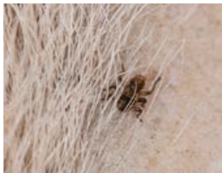
Hertenluisvlieg ( verliest vleugels als hij zich op een dier heeft genesteld)