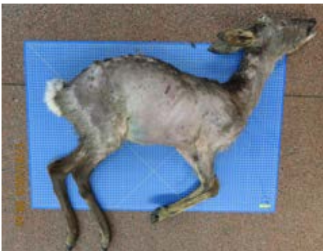
Ree met demodicose

De mijt loopt over de huid van het ene haarzakje naar het volgende en kan dan bij intensief onderling contact tussen reeën overgaan van het ene dier op het andere. Ga voor meer informatie over demodicose naar het DWHC bericht Kale reeën door demodex-mijten op onze website.