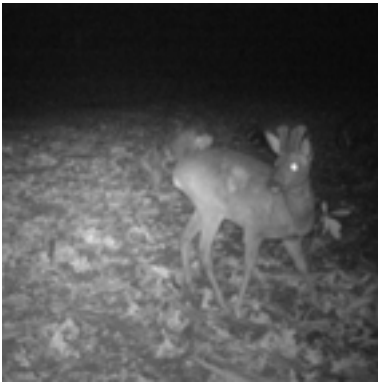
2 februari 2020: De andere kant van de reebok