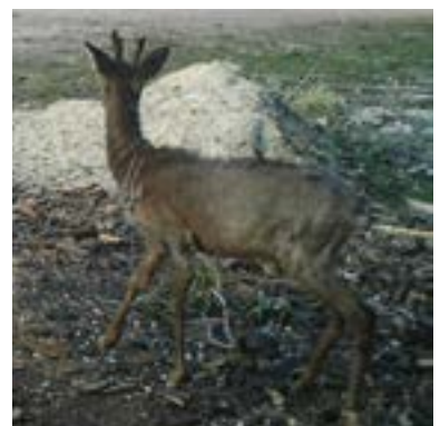
27 maart 2020: al weer wat meer rode haren

Het is onbekend hoe de vacht van de reebok er nu uitziet, omdat hij zich niet meer voor de wildcamera heeft laten zien.