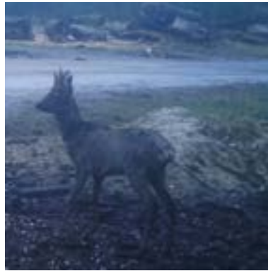
8 maart 2020: gewei geveegd, zo goed als kaal