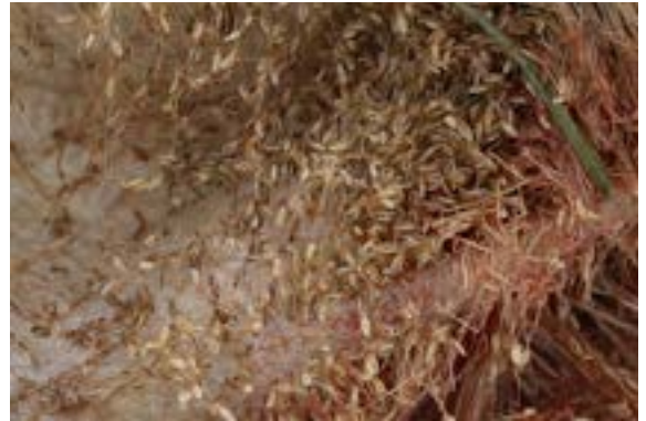
In de winter en vroege voorjaar vermenigvuldigen de vachtluizen zich. Luizen kunnen bij onderling contact op andere reeën worden overgedragen.

Hoewel er dus mogelijke oorzaken kunnen worden aangegeven, blijft het helaas gissen naar de daadwerkelijke oorzaak van het meer voorkomen van het 'Haarbruchsyndrom'.