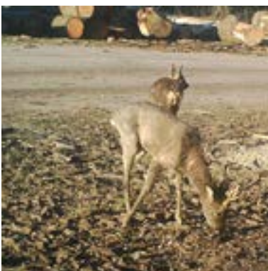
21 maart 2020: Ook de andere kant is bijna geheel 'kaal'.