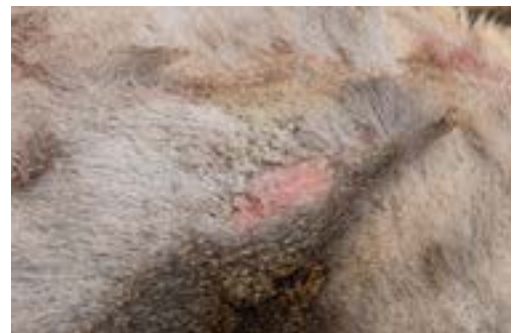
Ree met korte haren en een kale plek