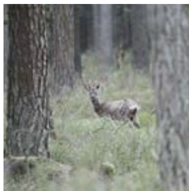
24 maart 2020: rode haar begint beetje door te komen