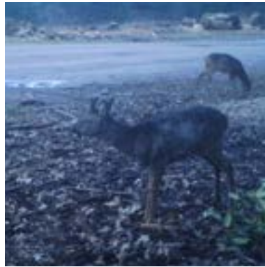
1 februari 2020: de plek is groter geworden