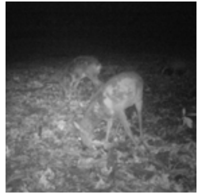
2 februari 2020 de uitbreiding is goed te zien