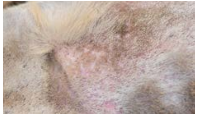
Bij sommige reeën waren ectoparasieten zichtbaar. Boven: Hertenluisvliegen en teek; Onder: vachtluizen.