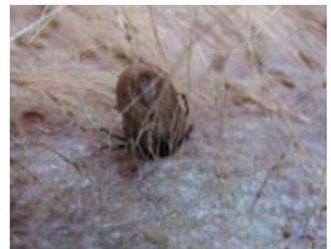
Bijna volgezogen teek